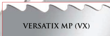
VERSATIX MP (VX)

Революционное новое исполнение зубьев, приводящее к сильному увеличению прочности зубьев, особенно предназначенное для прерывистого резания конструкционных материалов.